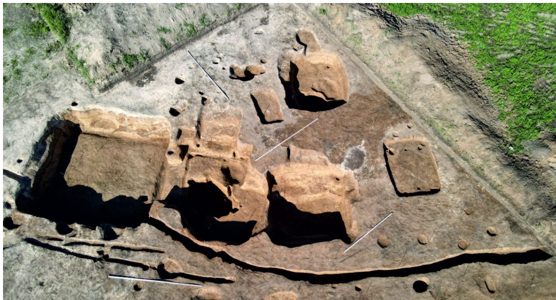
Частокольные канавки и комплекс подполий на селище Чадаево – 5

полоса шириной до 8 метров. По обеим сторонам от нее находились усадьбы площадью от 1000 до 7000 кв. метров с частокольными оградами. В некоторых местах линии частокольных канавок ветвятся и пересекают друг друга: это говорит о том, что границы дворов время от времени изменялись.