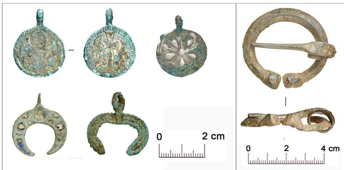
Селище Чадаево – 5. Слева: иконка, подвеска, лунница и муромская лунница. Справа: подковообразная фибула

О возможной верхней временной границе жизни поселения говорят находки фрагментов стеклянных браслетов, которые были наиболее популярны в первой трети XIII века и постепенно вышли из обихода после монгольского нашествия.