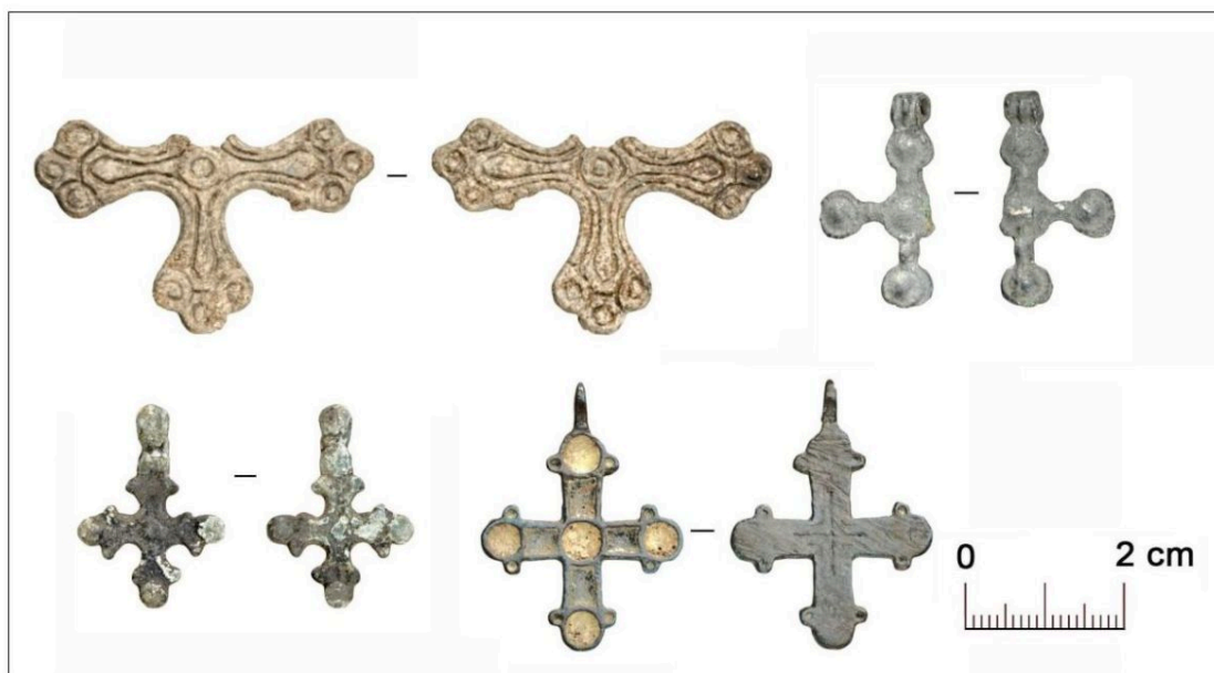
Селище Чаадаево – 5. Кресты-тельники

владимирских сел. На всех трех поселениях в изобилии представлены разнообразные бытовые предметы: ножи, кресала, детали замков, ключи. Найдены орудия труда, такие, как шиферные пряслица, шилья, иглы, оселки, фрагменты топоров, а также металлические украшения костюма, кресты-тельники. Кроме этого, на муромских селищах археологи нашли предметы вооружения и воинского снаряжения, стили для письма, книжные застёжки и некоторые другие статусные вещи, связанные с обиходом социальной элиты.