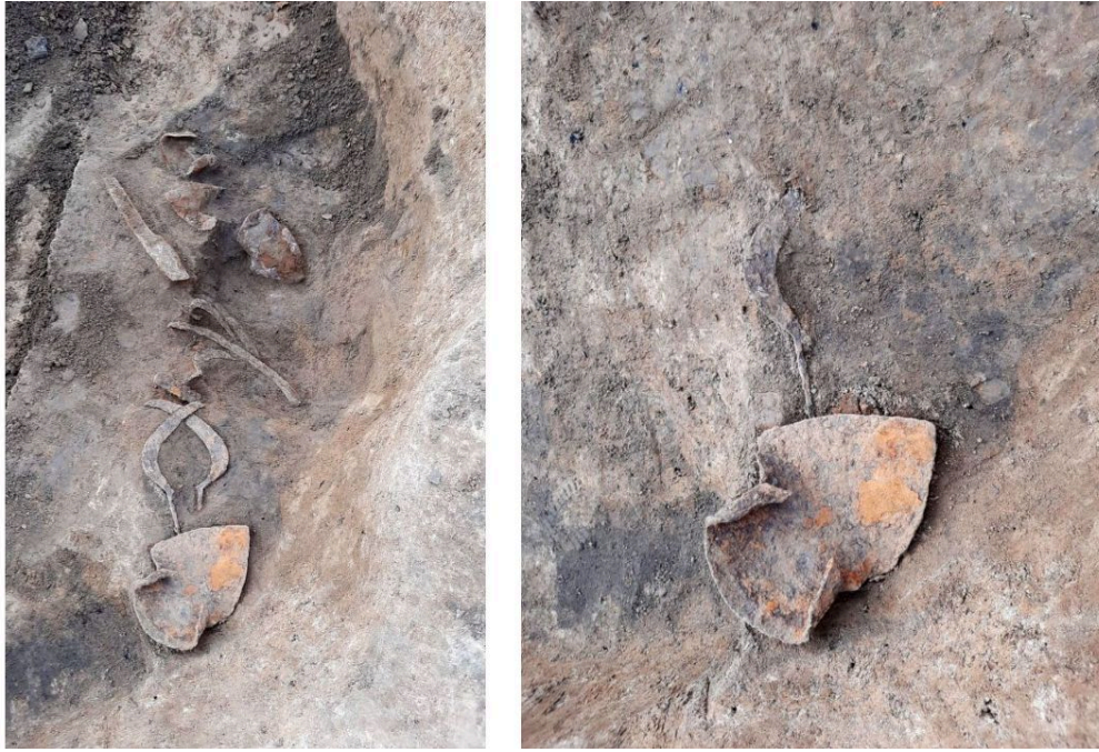
Селище Катышево – 1. Слева: склад сельскохозяйственных орудий in situ. Справа: плужный лемех и серп в процессе расчистки.

О богатстве и высоком социальном статусе насельников говорят также предметы, связанные с военными занятиями: это наконечники стрел, фрагмент кольчуги, фрагменты шпор, детали наборных поясов. На памятнике найдено необычно большое для сельских поселений количество стеклянных браслетов (около 150 фрагментов) – предметов, более свойственных городской культуре. Редкие находки, отражающие религиозный обиход – крест-энколпион с эмалью и деталь решетки хороса.