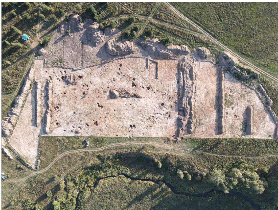
Селище Катышево – 1. Вид раскопа