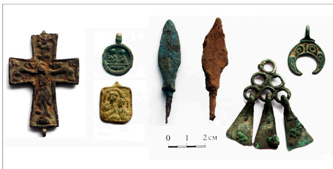
Селище Столбище. Слева направо: наперстный крест, иконки, стрелы, шумящая привеска,

Поселение Столбище на реке Ворше под Владимиром возникло не позднее середины XII века и продолжало существование до XVI века. Собранный здесь вещевая коллекция скромнее, чем на муромских селищах, но содержит ряд выразительных украшений костюма и предметов христианского культа домонгольского времени. На одном из участков здесь расчищены остатки плотной застройки XV–XVI веков: расположенные в ряд котлованы семи подполий, датировка которых определена по монетам. Селище интересно как памятник, отражающий длительную преемственность жизни небольшого поселения с периодическими сдвигами его основного ядра.