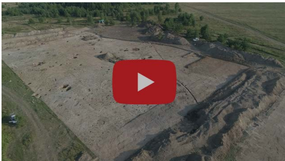
Селище Катышево - 1: вид сверху

«Раскопки селищ в Волго-Окском регионе на трассе скоростной автомагистрали Москва-Казань дали новые материалы, принципиально важные для характеристики сельских поселений домонгольского времени. Впервые в изучении этих поселений целиком вскрыты сельские усадьбы и установлен усадебный характер планировки сел XII века. Находки на сельских поселениях статусных вещей, связанных с повседневным обиходом и профессиональными занятиями элиты, подтверждает сделанные ранее на материалах Суздальского Ополя выводы о присутствии "дворов знати" на сельских поселениях и указывает на перспективность их поиска», – отметил Николай Макаров.