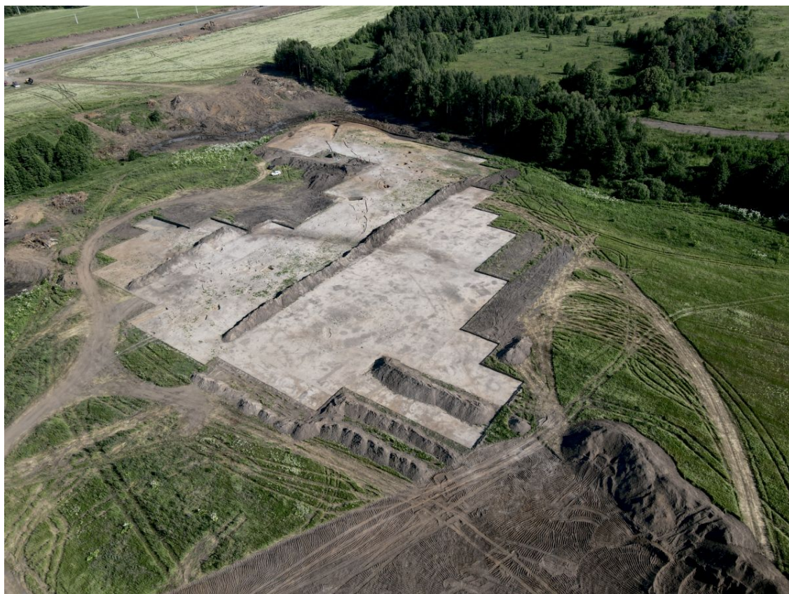
Селище Чадаево – 5. Общий вид