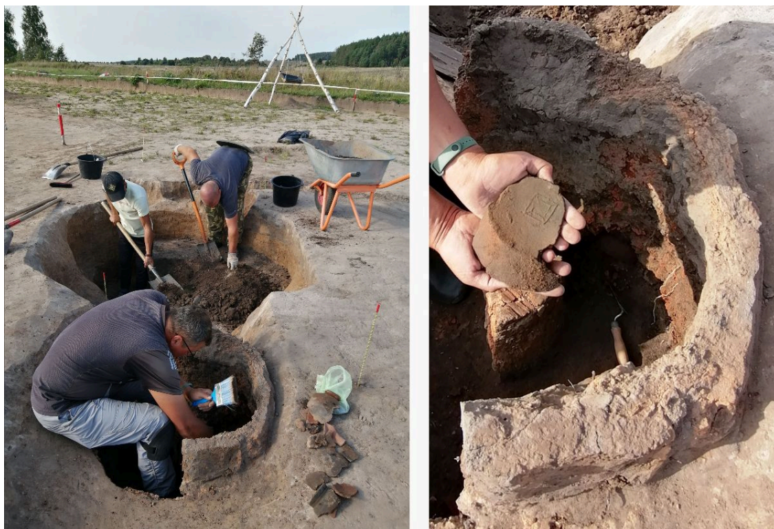
Слева: процесс разбора заполнения горна и предгорновой ямы. Справа: фрагмент донца красноглиняного горшка с клеймом из нижней части заполнения горна