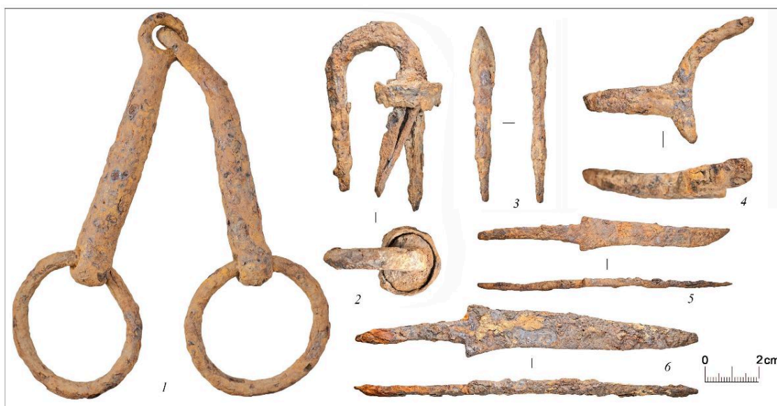
Селище Катышево – 1. Слева направо: 1 – удила, 2 – фрагмент замка, 3 – наконечник стрелы, 4 – фрагмент шпора, 5, 6 – ножи

Поселение Столбище на реке Ворше под Владимиром возникло не позднее середины XII века и продолжало существование до XVI века. Собранный здесь вещевая коллекция скромнее, чем на муромских селищах, но содержит ряд выразительных украшений костюма и предметов христианского культа домонгольского времени. На одном из участков здесь расчищены остатки плотной застройки XV–XVI веков: расположенные в ряд котлованы семи подполий, датировка которых определена по монетам. Селище интересно как памятник, отражающий длительную преемственность жизни небольшого поселения с периодическими сдвигами его основного ядра.