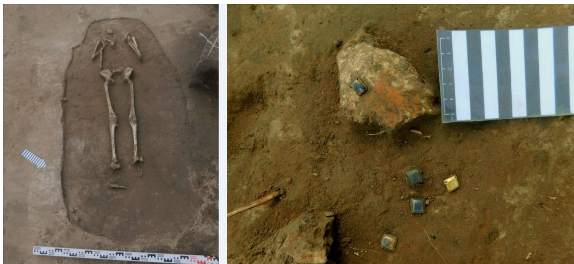
Слева направо: женское погребение, нашивные серебряные бляшки очелья из погребения

С внешней стороны ограды муромских селищ, недалеко от въезда в поселение, находились могильники: в Катышеве найдено два погребения, в Чадаево – 46 захоронений в неглубоких грунтовых ямах, образующих четыре ряда. Захоронения совершены по христианскому обычаю.