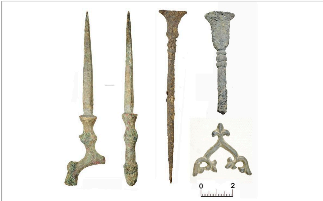
Селище Чаадаево – 5. Слева направо: деталь хороса, писала, книжная накладка

На поселении Катышево – 1 жизнь продолжалась в период с XII по XIV век, причем самая значительная часть сооружений и находок относится к XIII веку.