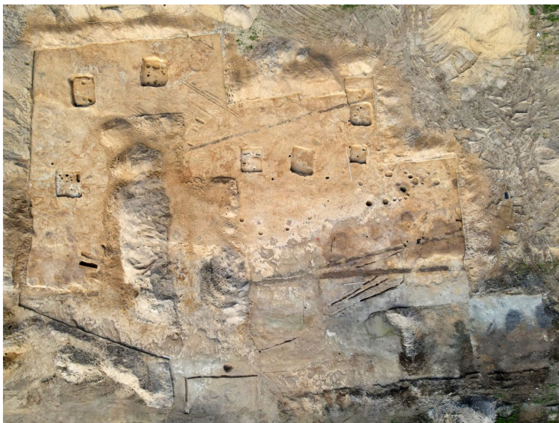
Селище Столбище. Общий вид раскопа с котлованами подполий, отмечающими места жилых построек

В культурном слое не сохранились остатки наземных построек. Однако на участках, где находились жилища, археологи зафиксировали ямы с бытовым мусором, пережженными камнями и обмазкой от разрушенных печей. На всех трех поселениях найдены глубокие прямоугольные подполья со следами деревянных конструкций: скорее всего, это следы погребов, которые находились непосредственно под жилищами.